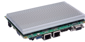
▲ Assembly view