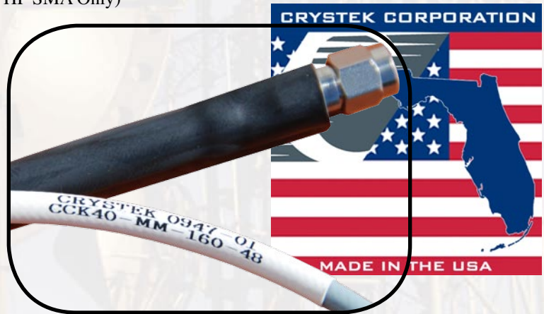
Electrical Test Data Supplied With Each Cable Assembly