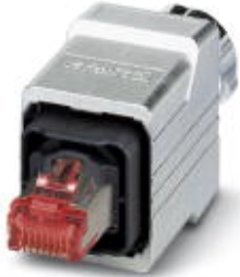
RJ45 connector, IP67, with push/pull interlocking (version 14), metal housing, for 1 Gbps, for 24 ... 25 AWG stranded conductors

Please be informed that the data shown in this PDF Document is generated from our Online Catalog. Please find the complete data in the user's documentation. Our General Terms of Use for Downloads are valid ( http://download.phoenixcontact.com )