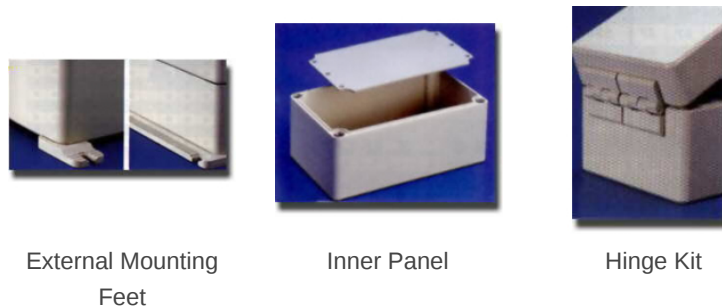
External Mounting Feet