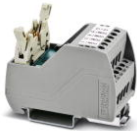
VARIOfACE Professional (VIP) board for the ROC800 controller

Please be informed that the data shown in this PDF Document is generated from our Online Catalog. Please find the complete data in the user's documentation. Our General Terms of Use for Downloads are valid ( http://phoenixcontact.com/download )