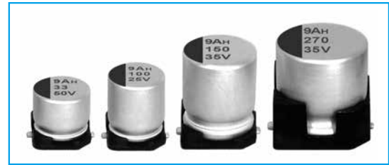
Marking color : Blue print