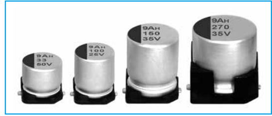
Marking color : Blue print