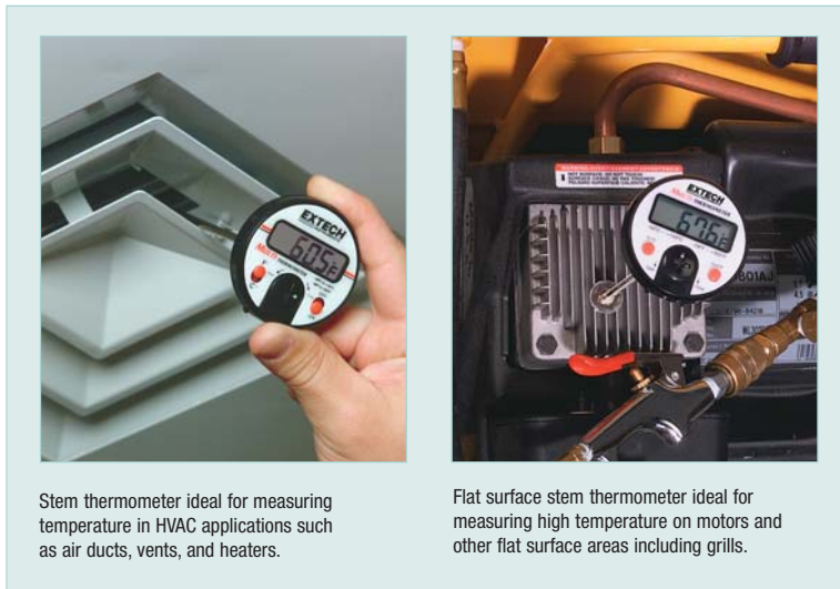
Stem thermometer ideal for measuring temperature in HVAC applications such as air ducts, vents, and heaters.