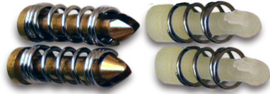
Push Pin Spring Kits