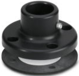
Foot for tube Ø 25 mm, metal, black

Please be informed that the data shown in this PDF Document is generated from our Online Catalog. Please find the complete data in the user's documentation. Our General Terms of Use for Downloads are valid ( http://phoenixcontact.com/download )