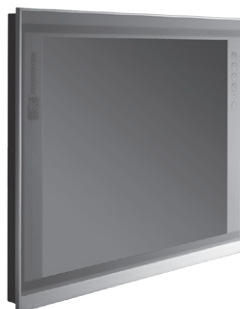
▲ Ultra-slim mechanism design