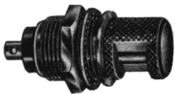
4-1930-2900-201 (without filter)