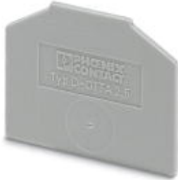
End cover, Length: 43.5 mm, Width: 1.5 mm, Color: gray

Please be informed that the data shown in this PDF Document is generated from our Online Catalog. Please find the complete data in the user's documentation. Our General Terms of Use for Downloads are valid ( http://download.phoenixcontact.com )