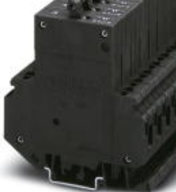
Thermomagnetic circuit breaker, 2-pos., normal blow, 1 N/O contact and 1 N/C contact, with universal foot for mounting on NS 32 or NS 35

Please be informed that the data shown in this PDF Document is generated from our Online Catalog. Please find the complete data in the user's documentation. Our General Terms of Use for Downloads are valid ( http://download.phoenixcontact.com )