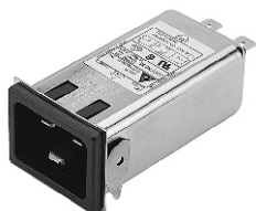
20GENG3E (Optional wire type)