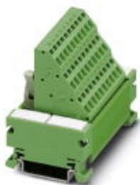
VARIOFACE COMPACT LINE, sensor module for the connection of 8 p-n-p sensors, for assembly on DIN rail NS 35/7.5, spring-cage connection

Please be informed that the data shown in this PDF Document is generated from our Online Catalog. Please find the complete data in the user's documentation. Our General Terms of Use for Downloads are valid ( http://phoenixcontact.com/download )