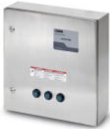
Indoor/outdoor lightning arrester and TVSS system for 277/480 V Wye system

Please be informed that the data shown in this PDF Document is generated from our Online Catalog. Please find the complete data in the user's documentation. Our General Terms of Use for Downloads are valid ( http://phoenixcontact.com/download )