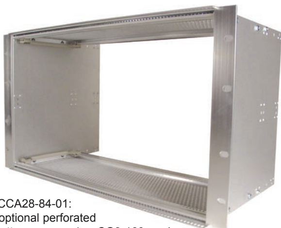
P/N CCA28-84-01: with optional perforated top/bottom covers. 1pr. CG3-160 card guides included

EMC subracks for Compact PCI, VME64X or PXI are available off-the-shelf in assembled or kit form. Standard 19" width or custom sizes available (contact factory). Can accommodate all 3U (single height, 3.937" or 100mm) and 6U (double height, 9.187" or 233.35mm) 0.062" to 0.100" thick boards.