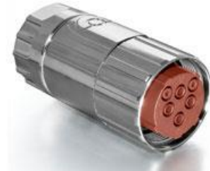
Contact Arrangement mating view

C ST A 263 NN 00 26 0001 000 C S A 263 N 00 26 0001 000