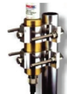
FM2 Mounting Kit (Sold separately)

Americas: +1.847.839.6925 IAS-AmericasSales@lairdtech.com