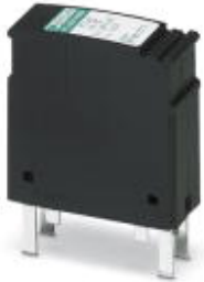
PLUGTRAB, plug-in surge protection for Foundation Fieldbus

Please be informed that the data shown in this PDF Document is generated from our Online Catalog. Please find the complete data in the user's documentation. Our General Terms of Use for Downloads are valid ( http://phoenixcontact.com/download )