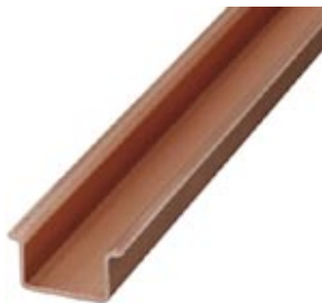
DIN rail, material: Copper, unperforated, 1.5 mm thick, height 15 mm, width 35 mm, length: 2 m

Please be informed that the data shown in this PDF Document is generated from our Online Catalog. Please find the complete data in the user's documentation. Our General Terms of Use for Downloads are valid ( http://download.phoenixcontact.com )