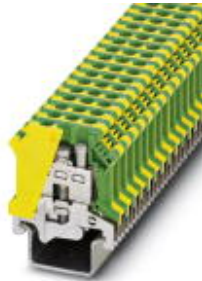
Ground terminal block with screw connection, cross section: 0.5 - 6 mm 2 , AWG: 20 - 8, width: 8.2 mm, color: green-yellow

Please be informed that the data shown in this PDF Document is generated from our Online Catalog. Please find the complete data in the user's documentation. Our General Terms of Use for Downloads are valid ( http://download.phoenixcontact.com )