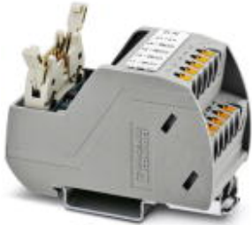
VARIOFACE Professional (VIP) board for the ROC800 controller

Please be informed that the data shown in this PDF Document is generated from our Online Catalog. Please find the complete data in the user's documentation. Our General Terms of Use for Downloads are valid ( http://phoenixcontact.com/download )