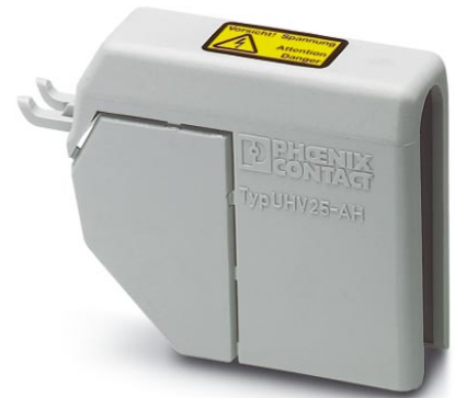
Illustration shows the product version UHV 25-AH

http://eshop.phoenixcontact.de/phoenix/treeViewClick.do?UID=2130460