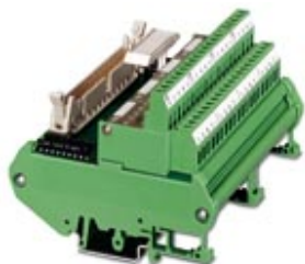
VARIOFACE interface module, with LED, for 8 channels

Please be informed that the data shown in this PDF Document is generated from our Online Catalog. Please find the complete data in the user's documentation. Our General Terms of Use for Downloads are valid ( http://phoenixcontact.com/download )