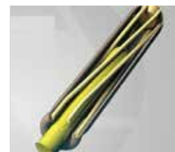
Cross Section - Mated View