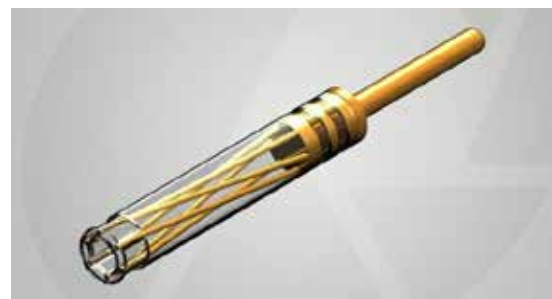
Micro-Hyperboloid Socket Contact