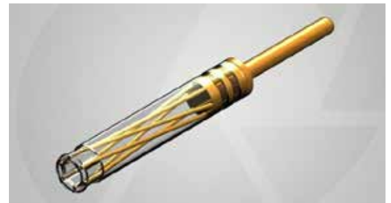
Micro-Hyperboloid Socket Contact