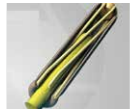
Cross Section - Mated View