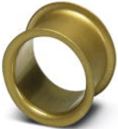
Adapter sleeve, Nominal current: 35 A, Color: black

Please be informed that the data shown in this PDF Document is generated from our Online Catalog. Please find the complete data in the user's documentation. Our General Terms of Use for Downloads are valid ( http://phoenixcontact.com/download )