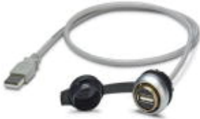
USB service socket, 0.6 m

Service socket with USB (socket/plug), type A with 0.6 m cable