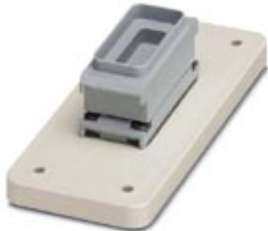
Adapter plate, size B16, reinforced, including panel mounting frame with DSUB 9 protective cover and without contact insert

Please be informed that the data shown in this PDF Document is generated from our Online Catalog. Please find the complete data in the user's documentation. Our General Terms of Use for Downloads are valid ( http://download.phoenixcontact.com )