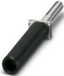
Female test connector, Color: black

Please be informed that the data shown in this PDF Document is generated from our Online Catalog. Please find the complete data in the user's documentation. Our General Terms of Use for Downloads are valid ( http://phoenixcontact.com/download )