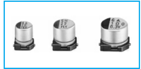
Marking color : Black print