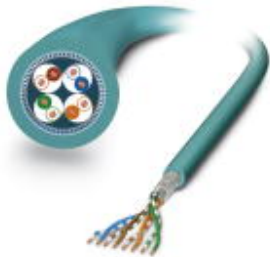
Bus system cable, ETHERNET, 8-pos., PUR halogen-free blue, 4x2x26 AWG. Cable ring: 100 m

Please be informed that the data shown in this PDF Document is generated from our Online Catalog. Please find the complete data in the user's documentation. Our General Terms of Use for Downloads are valid ( http://download.phoenixcontact.com )