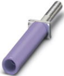
Female test connector, Color: violet

Please be informed that the data shown in this PDF Document is generated from our Online Catalog. Please find the complete data in the user's documentation. Our General Terms of Use for Downloads are valid ( http://download.phoenixcontact.com )