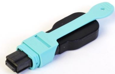
MPO Loopback w/Pull Tab