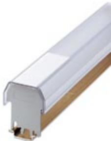
Insert strip, white, unlabeled, Mounting type: Insert, Lettering field: 35 x 500 mm

Please be informed that the data shown in this PDF Document is generated from our Online Catalog. Please find the complete data in the user's documentation. Our General Terms of Use for Downloads are valid ( http://phoenixcontact.com/download )