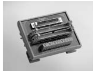
ADAM-3968/50 68-pin SCSI to 2 50-pin Box Header Board