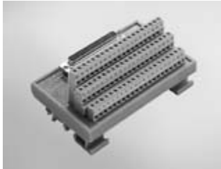
ADAM-3962 DB62 DIN-rail Wiring Board