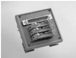
ADAM-3968/20 68-pin SCSI to 3 20-pin Box Header Board

PCI-1710U/UL, PCI-1710HGU, PCI-1711U/UL, PCI-1712/L, PCI-1716/L, PCI-1741U, PCI-1742U, PCI-1747U, PCI-1721, PCI-1723, PCI-1751, PCI-1753, PCI-1723, PCI-1780U