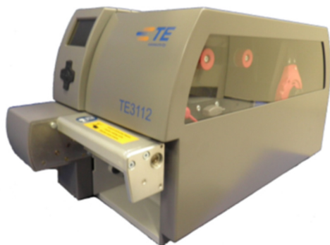
TE3112 fitted with, metal cover and Cutter/perforator