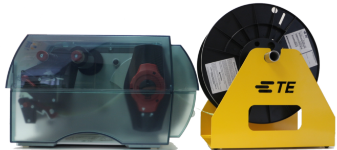
TE3112 with Universal reel holder