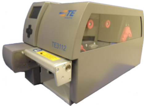
TE3112 fitted with, metal cover and Cutter/perforator