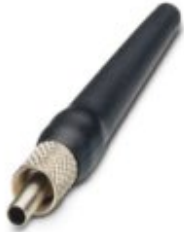
QUICKON-FSMA plug, for polymer fibers, 4-part set

Please be informed that the data shown in this PDF Document is generated from our Online Catalog. Please find the complete data in the user's documentation. Our General Terms of Use for Downloads are valid ( http://download.phoenixcontact.com )