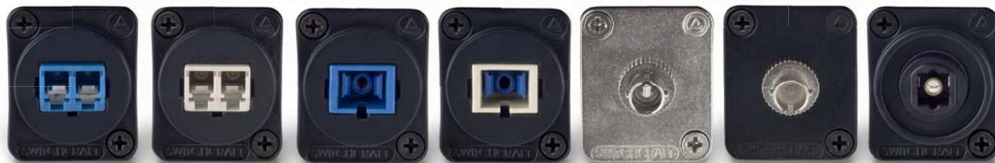
EHLC2 EHLC2M EHSC2 EHSC2M EHST2 EHST2MB EHTL2