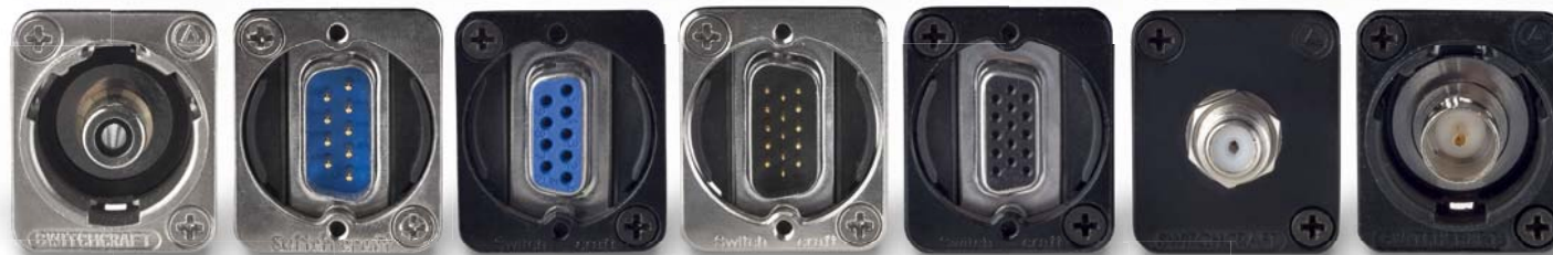
EHRCA2 EHDB9MF EHDB9FFB EHHD15MF EHHD15FFB EHFFB EHBNC2B