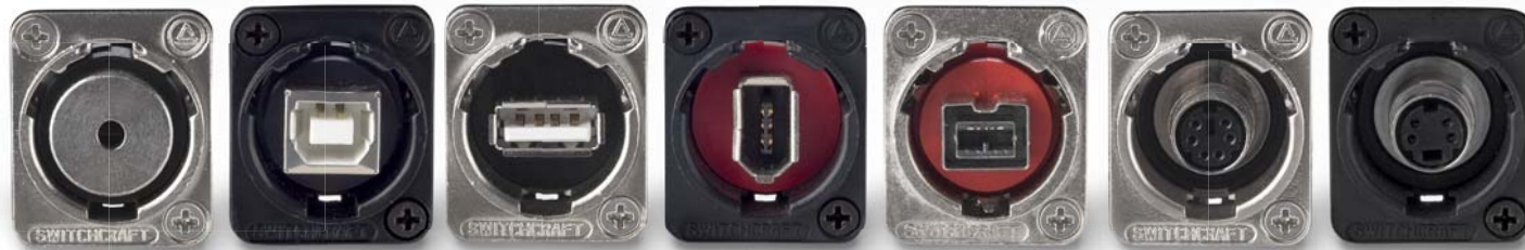
EH35MMSC EHUSBBAB EHUSBAB EHFWX2B EHF800X2 EH6MD2 EHSVHS2B