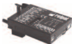
Time module COM3T