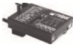
Time module COM3T