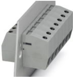
The illustration shows version HDFK 25 in gray

Please be informed that the data shown in this PDF Document is generated from our Online Catalog. Please find the complete data in the user's documentation. Our General Terms of Use for Downloads are valid ( http://download.phoenixcontact.com )