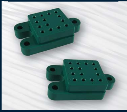
Mates with MIL-R-6106 & MS27743 Relays