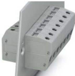
Feed-through terminal block, Connection method: Screw connection, Color: green-yellow

Please be informed that the data shown in this PDF Document is generated from our Online Catalog. Please find the complete data in the user's documentation. Our General Terms of Use for Downloads are valid ( http://download.phoenixcontact.com )