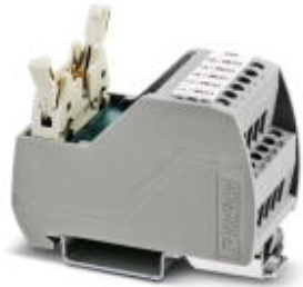
VARIOfACE Professional (VIP) board for the ROC800 controller

Please be informed that the data shown in this PDF Document is generated from our Online Catalog. Please find the complete data in the user's documentation. Our General Terms of Use for Downloads are valid ( http://phoenixcontact.com/download )