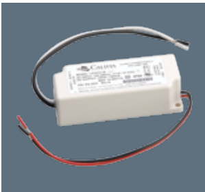
Class 2 Power Supply 12W Califa Lighting Part # - PS-1032

PRODUCT DETAILS For hardwiring with track systems, this Power Supply is best Suited for use with single track segments with lower wattage luminaires.