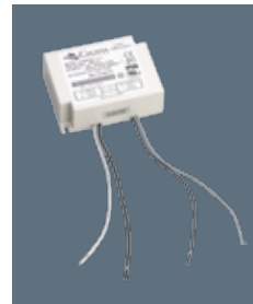
Class 2 Power Supply 40W Califa Lighting Part # - PS-1033

PRODUCT DETAILS For hardwiring with track systems, this Power Supply is best suited for use with multiple track segments with higher wattage luminaires.