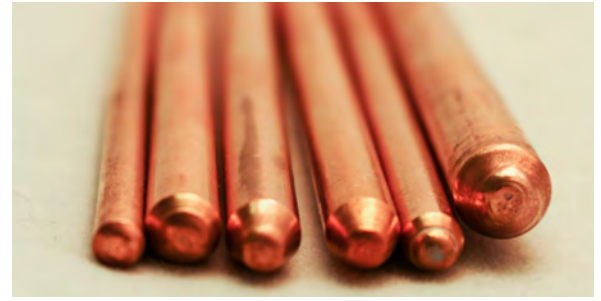
For Illustration Purposes ONLY.

Description: Closed evaporator-condenser heat transfer systems. A heat pipe's wick structure and embedded liquid enables it to produce a very high heat flux transport capability, which can be 10-20 times higher than the equivalent diameter solid copper pipe. Round heat pipes offer advantages for certain fin configurations at the condenser end.